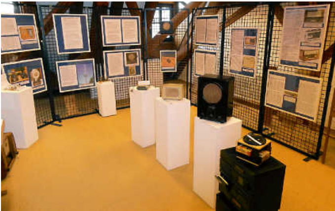
Einblick in die Gesamtszene der Radioausstellung

Sie ist zwar nochmals im Mai geöffnet, aber bei jedem Besuch kann etwas Neues entdeckt werden - wir meinen die Radioausstellung im Dorfmuseum Zehntscheuer , die am kommenden Sonntag, 23. April 2023 von 14 - 17 Uhr zusammen mit der musealen Dauerausstellung geöffnet sein wird.