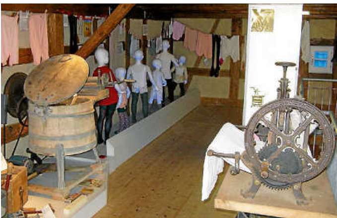
„Kalte Witterung, warme Kleidung“ – das ist eines der Gegensatzthemen im Museum „Heiß-Kalt“

Auch das Museum „Heiß-Kalt“ ist am kommenden Sonntag geöffnet