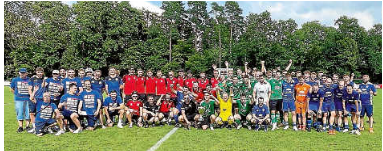
Alle teilnehmenden Mannschaften des Wanderpokalturniers

Am Freitagabend eröffnete der SVD gegen Sulz am Eck und konnte mit 4:1 gewinnen. Anschließend schlug der SV Oberjesingen den TSV Kuppingen mit 5:0. Weiter ging es am Samstagmorgen um 10:00 Uhr mit dem spannenden Spiel zwischen Deckenpfronn und Oberjesingen. Kurz vor Schluss gelang Tobias Wick der entscheidende Treffer zum 1:0-Sieg für den SVD. Nachdem sich Kuppingen und Sulz 2:2 trennten, folgte ein Einlage-spiel der Inklusionsmannschaft SVD III gegen eine AH-Auswahl der teilnehmenden Vereine. Dass auch hier das Ergebnis nicht zweitrangig ist, zeigte das Engagement und der Einsatzwillen, mit dem die Männer und Frauen zu Werke gingen. Am Ende stand es 3:3 unentschieden und jeder lief mit einem Lachen auf dem Gesicht vom Feld. „Ein echtes Highlight für uns vor so vielen Zuschauern zu spielen“, sagte Patrick Schwarz, Trainer des SVD III.