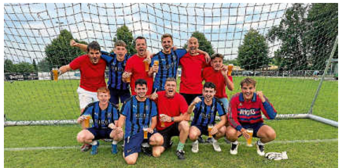
Die Finalisten des Elfmeterturniers

Am Ende setzte sich das Team der „Grobmotoriker“, bestehend aus Kickern vom VfL Nagold gegen das Team „Troy“ von Thomas Kauffmann & Bernd Paulus durch. Im kleinen Finale war das Team „Pit-Snack“ gegen „Die Matrosen und ihr Hafner“ erfolgreich.