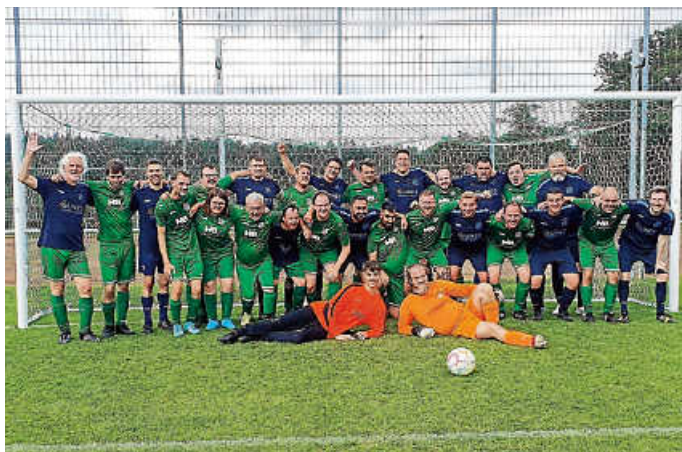
Inklusionsmannschaft u. AH-Auswahl aller teilnehmenden Ortschaften

In der vorletzten Partie behielt der SV Oberjesingen mit 3:2 die Oberhand gegen den SV Sulz am Eck, bevor der SVD im letzten Spiel gegen den TSV Kuppingen die Titelverteidigung des Wanderpokals mit einem 3:1-Sieg unter Dach und Fach brachte. Das war bereits der 31. SVD-Sieg in der 71. Auflage des Traditionsturniers.