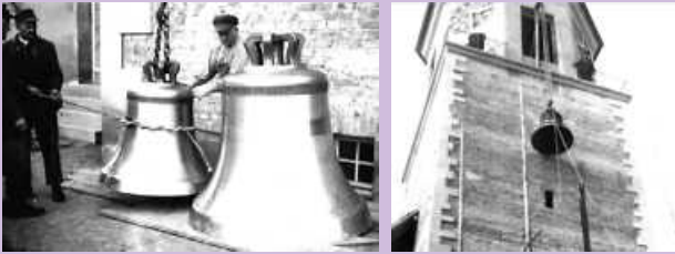
1957: Die Nikolauskirche erhält ein Vierergeläut

Eine Sonderausstellung über Glocken mit der Glockensammlung eines Mitbürgers im Museum Zehntscheuer Deckenpfronn