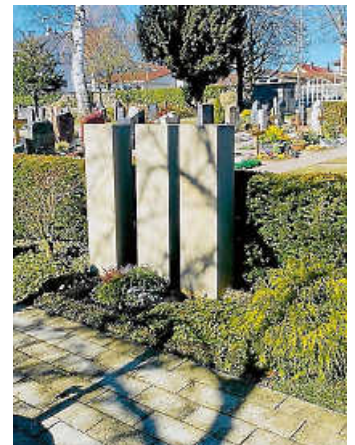
Gemeinschaftsgrabfeld für Urnen

Somit ermöglicht das Gemeinschaftsgrabfeld einen Ort des Gedenkens mit Namen und Daten, ohne dass Angehörige sich um die gärtnerische Pflege kümmern müssen. Die Pflege des Bereiches übernimmt die Gemeinde, für die Angehörigen fallen keine laufenden Grabpflegekosten an und das Grabfeld bleibt langfristig gepflegt und ansprechend.