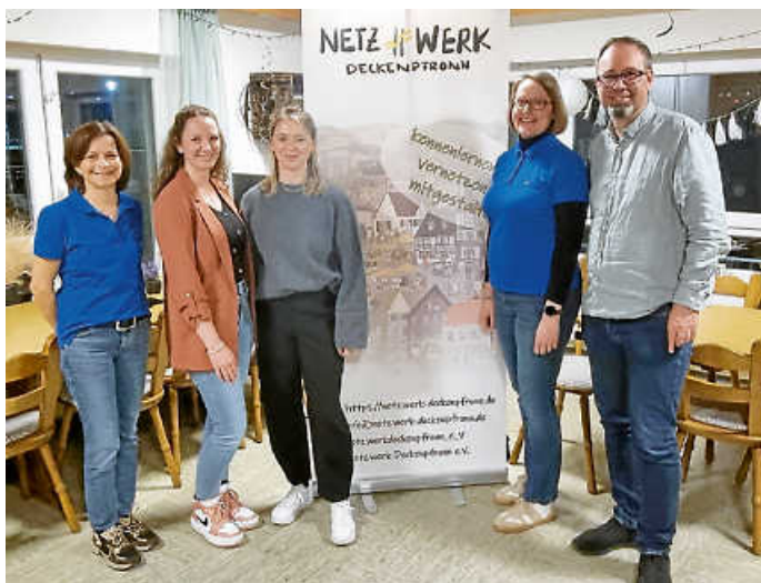
Die alte und neue Vorstandschaft.

oder Buchhaltung. Voraussetzung ist natürlich, dass sich jemand findet, der ein solches Projekt mit Engagement vorantreibt. Ideen und Vorschläge sind jederzeit willkommen.