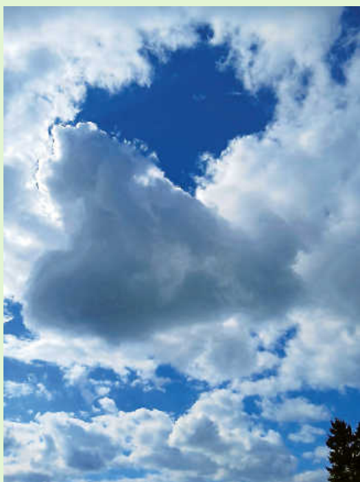
„...Herzwolke am Himmel!“

Wir veröffentlichen unter dieser Rubrik Fotos zum „Teilen“.