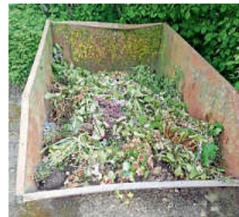
Container für Humus- und Erd-Abfälle

Der Grünabfall-Container in der Backhausgasse wurde bereits Anfang März abgeholt. Trotz der Abholung des Containers möchten wir darauf hinweisen, dass die Grünabfälle weiterhin am gleichen Platz abgelegt werden können. Die Entsorgung erfolgt regelmäßig durch das Team des Gemeindebauhofs.