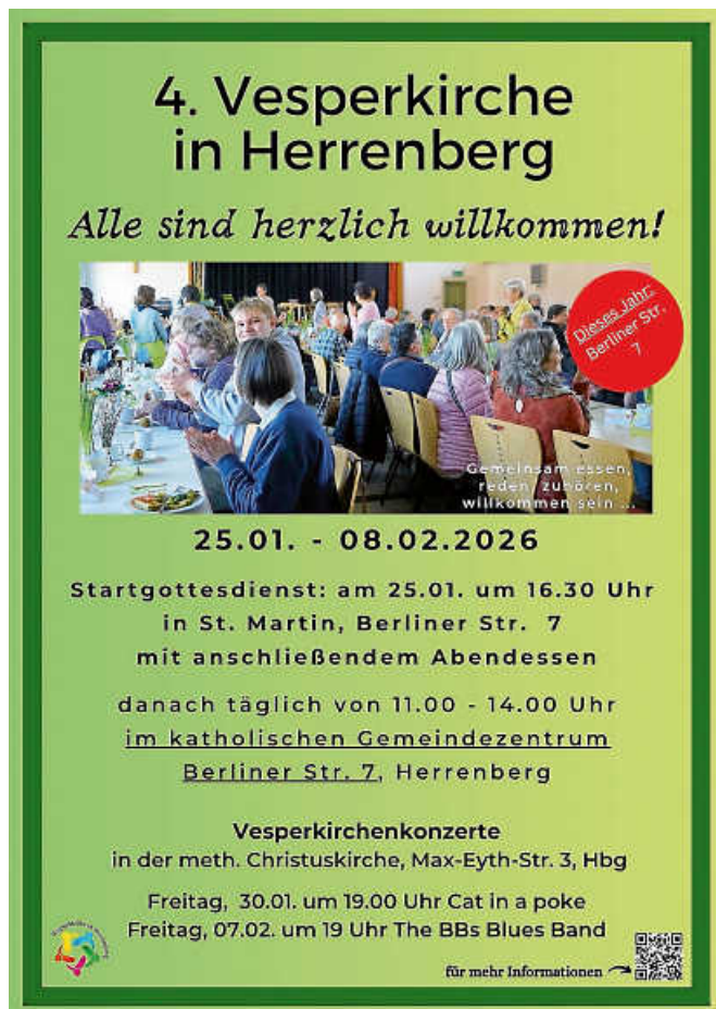
Plakat: Vesperkirche Herrenberg