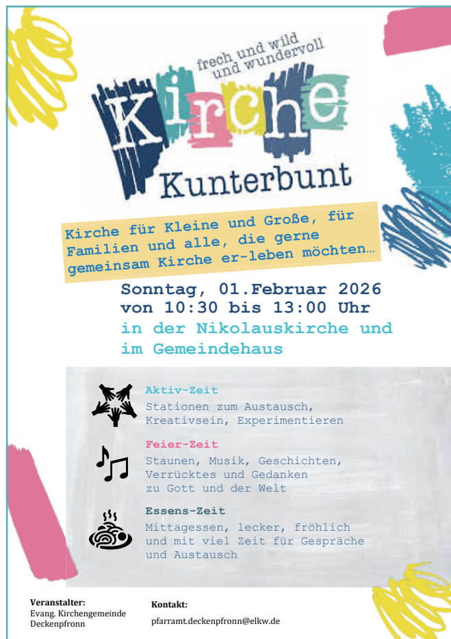
Plakat: Ev. Kirchengemeinde Deckenpfronn